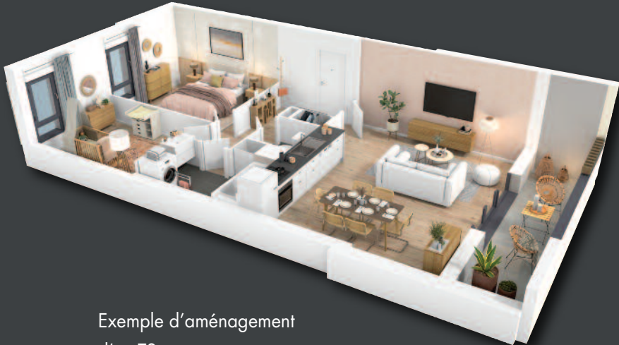
Exemple d'aménagement d'un T3