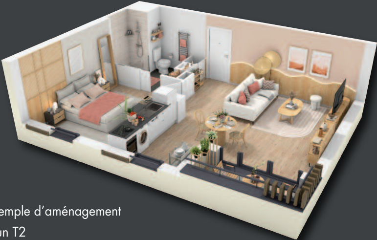
Exemple d'aménagement d'un T2